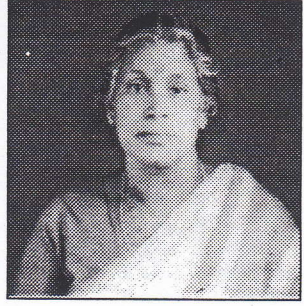
யானதும் எமது அதிபர் அக்கிணையுடன் தொடர்பு கொண்டபோது இதை நீண்ட காலச்செயற்பாடாகத் தாம் திட்டமிட்டிருப்பதாக பெருவிருப்புடன் தெரிவித்

வேலணை மத்திய மகா வித்தியாலயத்தில் தற்போது கல்வி கற்றுவுரும் மாணவர்களுக்குப்போசாக்கு உணவு வழங்கும் திட்டத்திற்கு வேலணை ம.ம.வி. பழைய மாணவர்சங்கத்தினர் மீண்டும் 1125டொலர்களைக் கடந்த 22.05.99 அன்று அனுப்பி வைத்துள்ளார்கள். சத்துணவுகள் உட்கொள்ள முடியாத பொருளாதார நிலைமை காரணமாக உற்சாகமிழந்து கல்வியிலும்